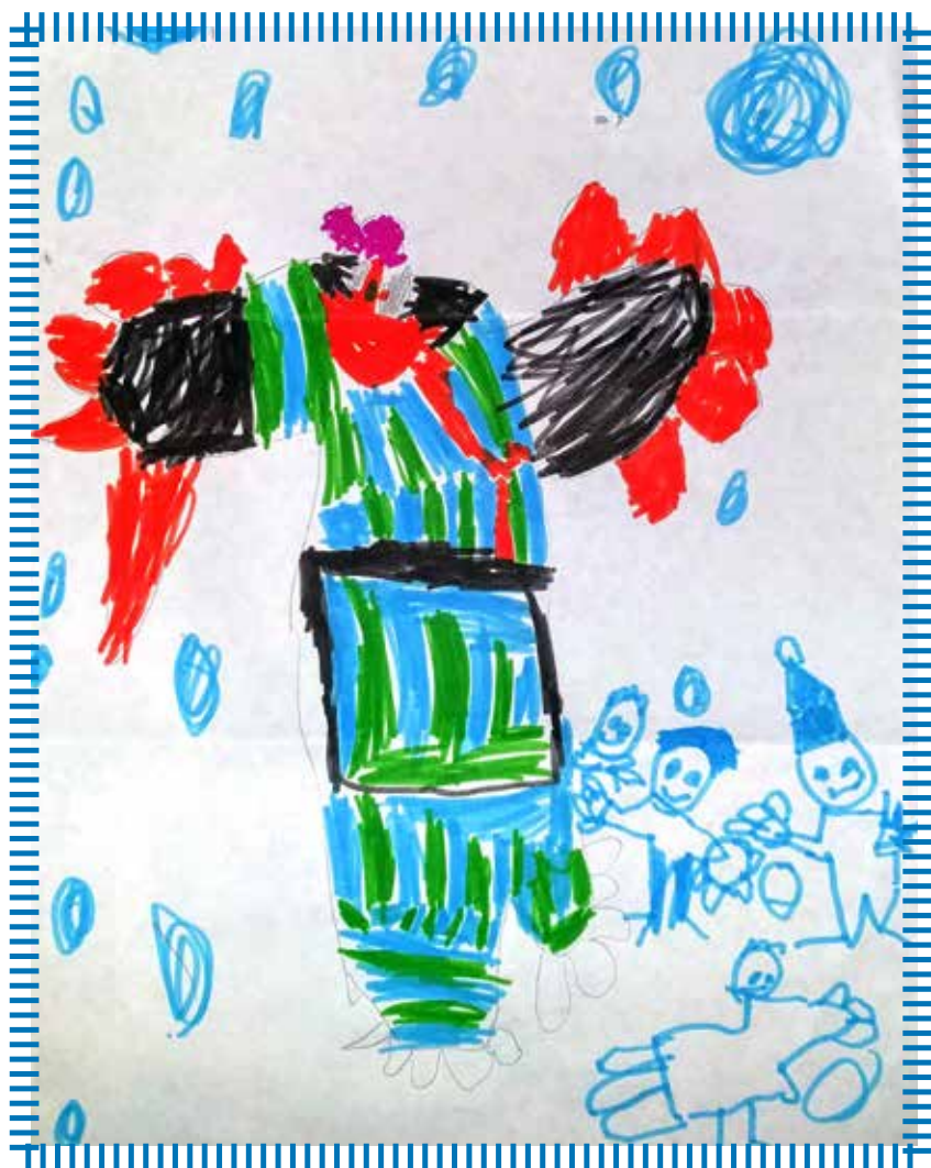
Titel: "Reuzekonijn met kindjes" door Sami Dacquin, Zilverhof 10. Het sneeuwt en Sami speelt met de bal (onderaan rechts!)