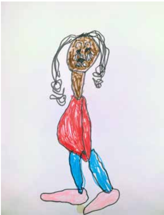
Titel: "Ikke " - Zelfportret Morgan, Abrahamstraat 16.

Wil je jouw tekening/foto in het volgend krantje zien, steek maar in mijn brieven- bus: Abrahamstraat 10. Inscannen en doormailen kan ook! prinsen_prinsessen@ outlook.com