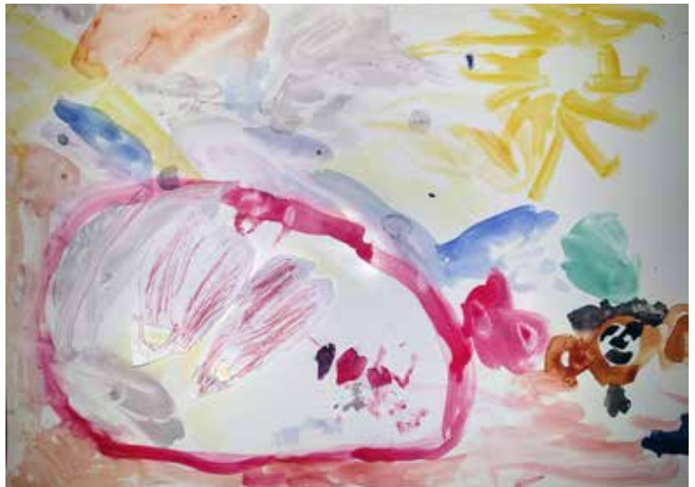
Titel: "Samen" - de eerste tekening die broer en zus samen tekenden zonder ruzie te maken!! Thibeau en Morgan, Abrahamstraat 16.

Wil je jouw tekening/foto in het volgend krantje zien, steek maar in mijn brieven- bus: Abrahamstraat 10. Inscannen en doormailen kan ook! prinsen_prinsessen@ outlook.com